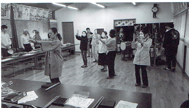
2017年5月13日(出口コミ隊のお囃子体験 (八幡八雲神社参集殿))