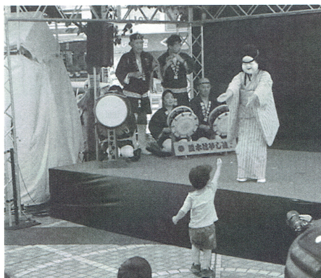
伝承のたまてばこ ～多摩伝統文化フェスティバル 2019～

ポーツ等を通じた相互交流事業を行ってまいります。結びに、貴連合会の更なるご発展と皆様のますますのご活躍を心から祈念申し上げます、挨拶とさせていただきます。