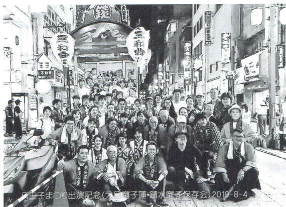
八王子まつり出演記念(一) 鉦水囃子保存会 2019-8-4