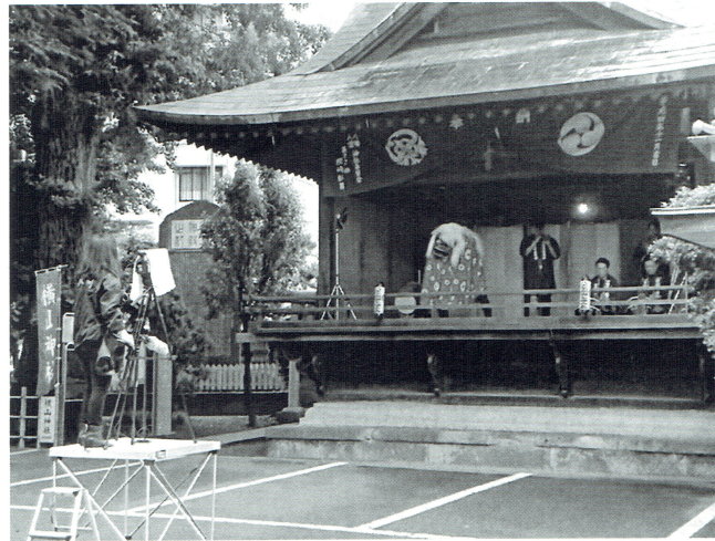
昨年の八王子商工会議所 H.P. 用囃子撮影

う、また地域の賑わいを取り戻すため、当会議所としても出来る限りの「場づくり」に力を入れてまいりますので、今後ともご協力の程宜しくお願いいたします。