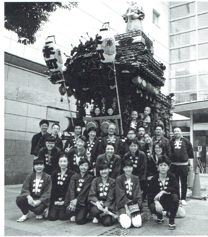
本町囃子連 70 周年記念時の集合写真

今年こそは「八王子まつり」の開催を願っております。 今後とも本町囃子連をどうぞ宜しくお願い申し上げます。