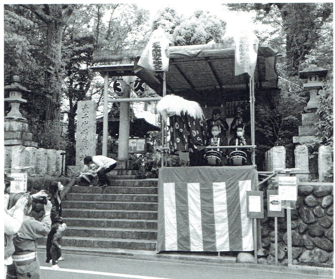
4月24日(日) 三年ぶりの産千代稻荷神社祭礼