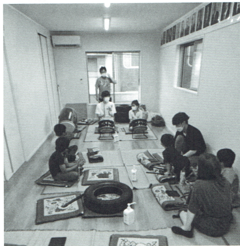
町会会館での練習風景

ここ数年、幼少から練習に励み、頑張ってくれておりました若手達も立派に成長していつてくれて、当会を盛り上げてくれております。