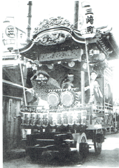
戦前の写真帖より

私たち上柚木囃子連は地元の仲間や、有志の皆さんと共に地元の愛宕神社を中心に活動しております。囃子連としての歴史はかなり古いという話を、子供の頃に親方連中から聞かされておりました。ただ戦中に一度活動が途切れてしまい、戦後祖父たちが北野囃子連（目黒流）の皆様になりに指導を受け復活を果たしたとのこと。その後多くの囃子方に指導をしてきた北野囃子連から、各地域に戻り目黒流を継承した囃子連が生まれたと聞いております。